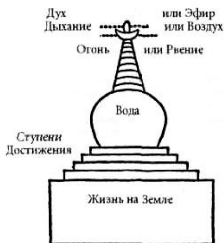
Символика тибетских чортепов.

Чортен — это полный символ нашей веры. Мы рождаемся на земле. В течение всей жизни мы взбираемся или пытаемся взобраться как можно выше по Ступеням Достижения. Наконец, испустив последний вздох, мы входим в царство Эфира, или Духа. Затем вновь рождаемся для получения нового урока. Колесо Жизни символизирует этот бесконечный цикл: рождение — жизнь — смерть — дух — рождение и т. д.