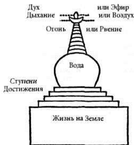
Символика тибетских чортемов.

Чортен — это полный символ нашей веры. Мы рождаемся на земле. В течение всей жизни мы взбираемся или пытаемся взобраться как можно выше по Ступеням Достижения. Наконец, испустив последний вздох, мы входим в царство Эфира, или Духа. Затем вновь рождаемся для получения нового урока. Колесо Жизни символизирует этот бесконечный цикл: рождение — жизнь — смерть — дух — рождение и т. д.